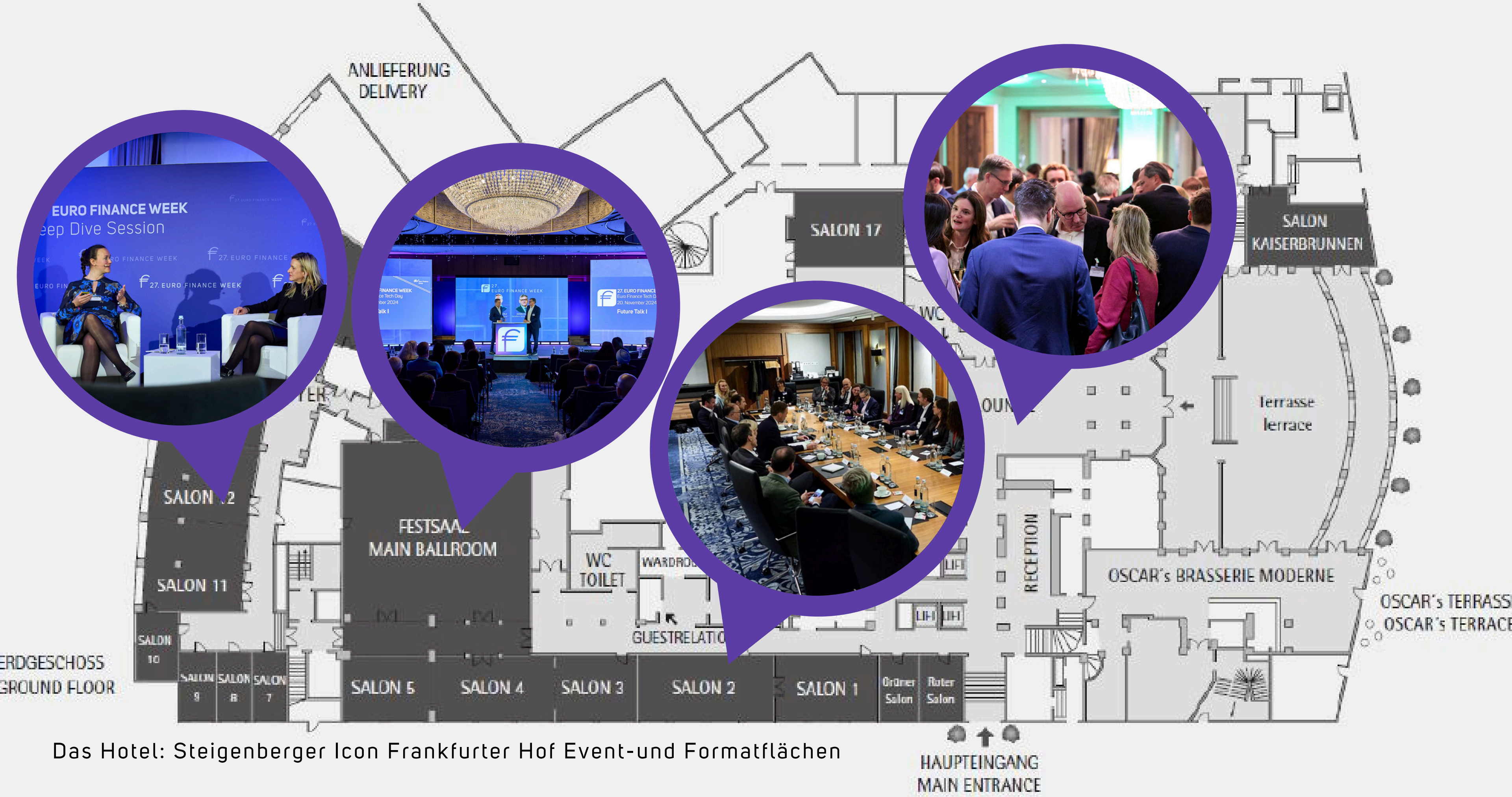
Das Hotel: Steigenberger Icon Frankfurter Hof Event-und Formatflächen